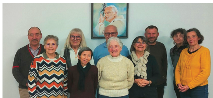
Ici le groupe de Salon de Provence.

Jean-Pierre Colombo pour les différents groupes